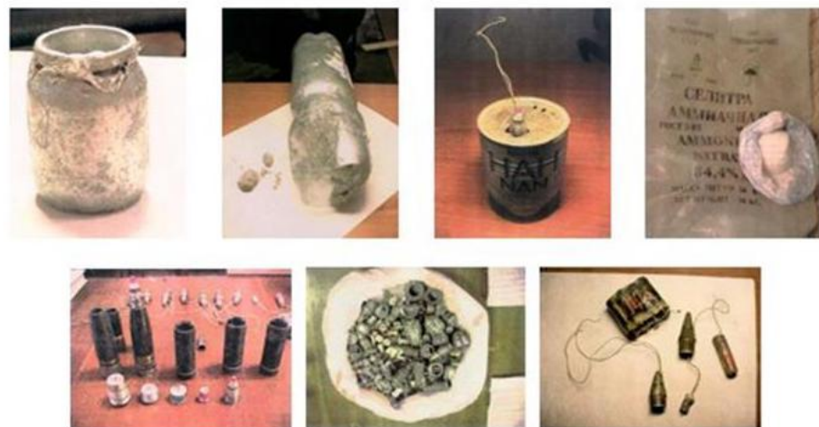
Фотографии взрывных устройств и их компонентов, изготовленных из штатных боеприпасов, аммиачной селитры и алюминиевой пудры, изъятых в процессе оперативно-розыскных мероприятий оперработниками ФСБ России

ПОМНИТЕ: внешний вид предмета может скрывать его настоящее назначение. В качестве камуфляжа для взрывных устройств используются обычные бытовые предметы: сумки, пакеты, свертки, коробки, игрушки и т.п.